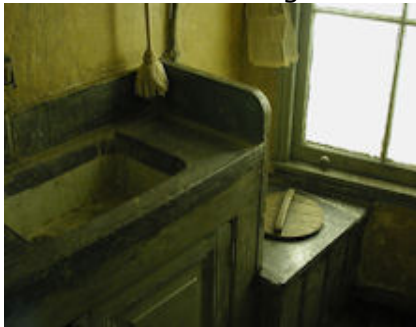
Poepdoos in de keuken

Wanneer de woning deel uitmaakte van een woonblok moest