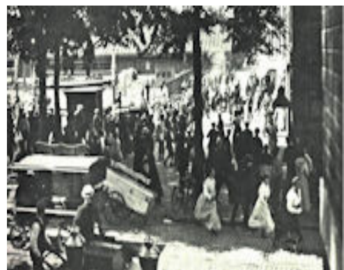
De Groenmarkt waar werd geplunderd en de politie een charge uitvoerde - de stofwolk rechts van het midden zou een pistoolschot zijn. (Het Leven - dinsdag 10 juli 1917)

De opstand werd neergeslagen, maar de voedseltoestand verslechterde verder. In het laatste oorlogsjaar 1918 - Pa is 10 jaar - daalde het broodrantsoen naar 2 ons en zelfs dat werd niet altijd gehaald. De SDAP wethouder Vliegen vatte de sfeer als volgt samen: "Het was alsof alle ongeluk zich ophoopte. Grote massa's die leefden op het randje van