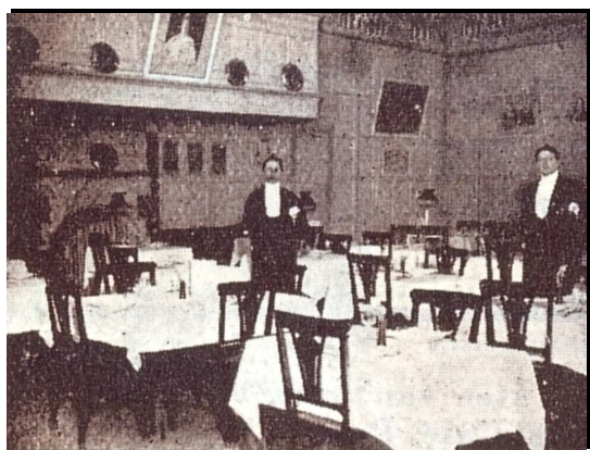
Zuid-Hollands Koffiehuis 's-Gravenhage 1911