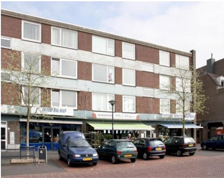
Nieuwe Markt 34, Echt

Het is december 1967. We hebben besloten om het avontuur in de Dietsche Taveerne te beëindigen om de simpele reden dat we geen droog brood verdienden. Ik ging op zoek naar een baan. Met de feestdagen gingen we naar Soest en op de terugweg in het nieuwe jaar reden we langs de Alfa brouwerij in Schinnen, waar we onze schuld van ca fl 1500,- met de inventaris van de Dietsche Taveerne verrekenen. Voor de laatste maand was dat een halve maand huur. En dat kregen we op papier. Maar ik moest wel mijn papieren erin houden, zodat de opvolgers die niet over die