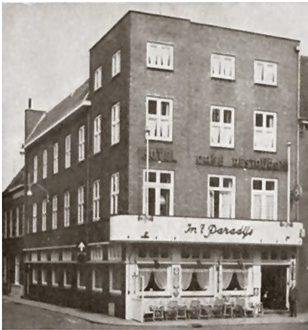
HOTEL-CAFÉ-RESTAURANT IN 'T PARADIJS MUNSTERPLEIN - ROERMOND - TEL. 04750-2914

Mijn eerste baan na het Mondernemerschap was zelfstandig werkend kok 'In 't Paradijs' op de hoek van de Paredisstraat en het Munsterplein in Roermond. Het was een heel ander bedrijf dan de naam deed vermoeden. Daar mocht ik ervaren hoe de mensen die bij ons werkten, mijn moeder hebben ervaren. Plotseling was ik maar 'personeel'. Ik verdiende fl 125,- per week en de huur van de flat was fl 150,- per maand. 'Het Paradijs' was een verlopen bedrijf en er kwamen nauwelijks gasten. Mijn voornaamste taak bestond uit het koken voor de familie. Moeders kocht in en bepaalde wat er werd gegeten. Hoe over personeel werd gedacht bleek onder ander uit onze warme maaltijd. Van de schillen van spruitjes die ik voor de familie moest schoonmaken, moest ik stampot maken. Als nagerecht maakte ik elke dag pudding, totdat ze het zat waren. Toen moest ik wat anders verzinnen, want er was geen custard meer. Maar ja custard is maïzena met een kleurtje, dus werd het toch weer