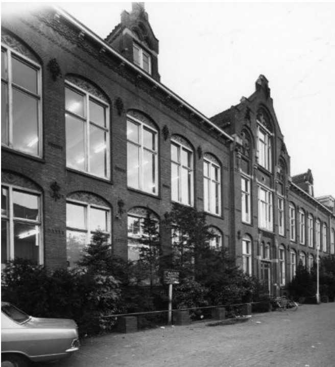
De 1ste Algemene Technische School in 1973