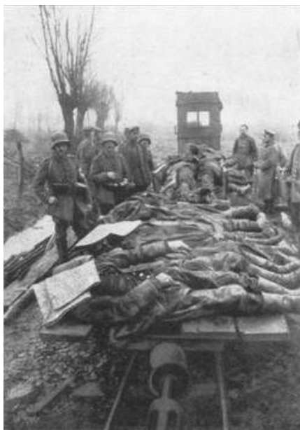
Transport van gevallen Duitse soldaten in Vimy-Arras 1917

E R was eens een soldaat, die gesneuveld was op het slagveld. Nadat hij een tijdje in het hiernamaals had doorgebracht, ging hij weer 'ns kijken hoe het op aarde was afgelopen, nadat hij als een echte held was gesneuveld.